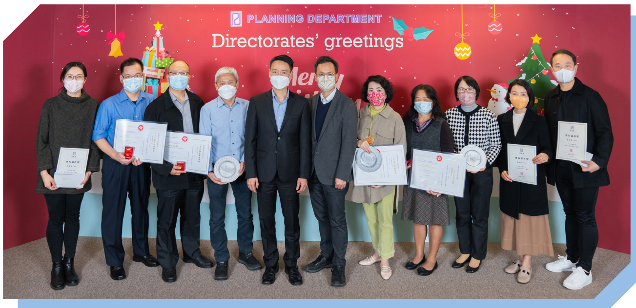
长期优良服务奖励计划