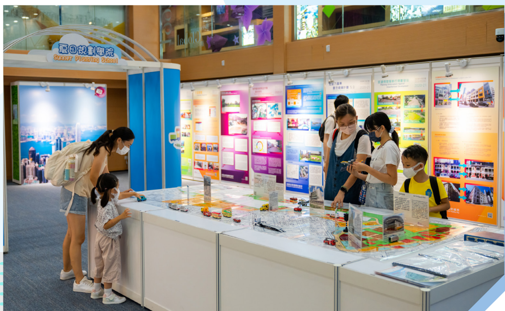
「规划宜居健康的城市」展览及夏日规划学院