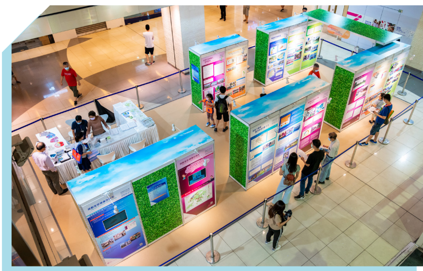
在商场举办巡回展览

尽管在 2019 冠状病毒疫情下，我们仍然在 58 所大学、中小学及特殊学校进行了探访／分享，并在 8 个公众场地举行展览。