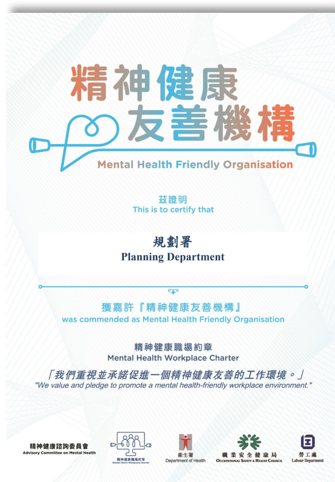
精神健康友善机构

本署自二零二零年起参与由卫生署、劳工处及职业安全健康局共同推行的《精神健康职场约章》（下称《约章》）。《约章》旨在于职场推广心理健康，包括建设一个互相尊重和正面的工作环境、推广积极聆听和沟通、鼓励求助、以及促进对精神困扰的及早识别和及时处理。《约章》的目标是为精神受困的同事创造一个包容及友善的工作环境。通过签署《约章》，我们必定重视并承诺推动一个精神健康友善的工作环境。本署在上述领域的表现获得《约章》主办方确认为「精神健康友善机构」。