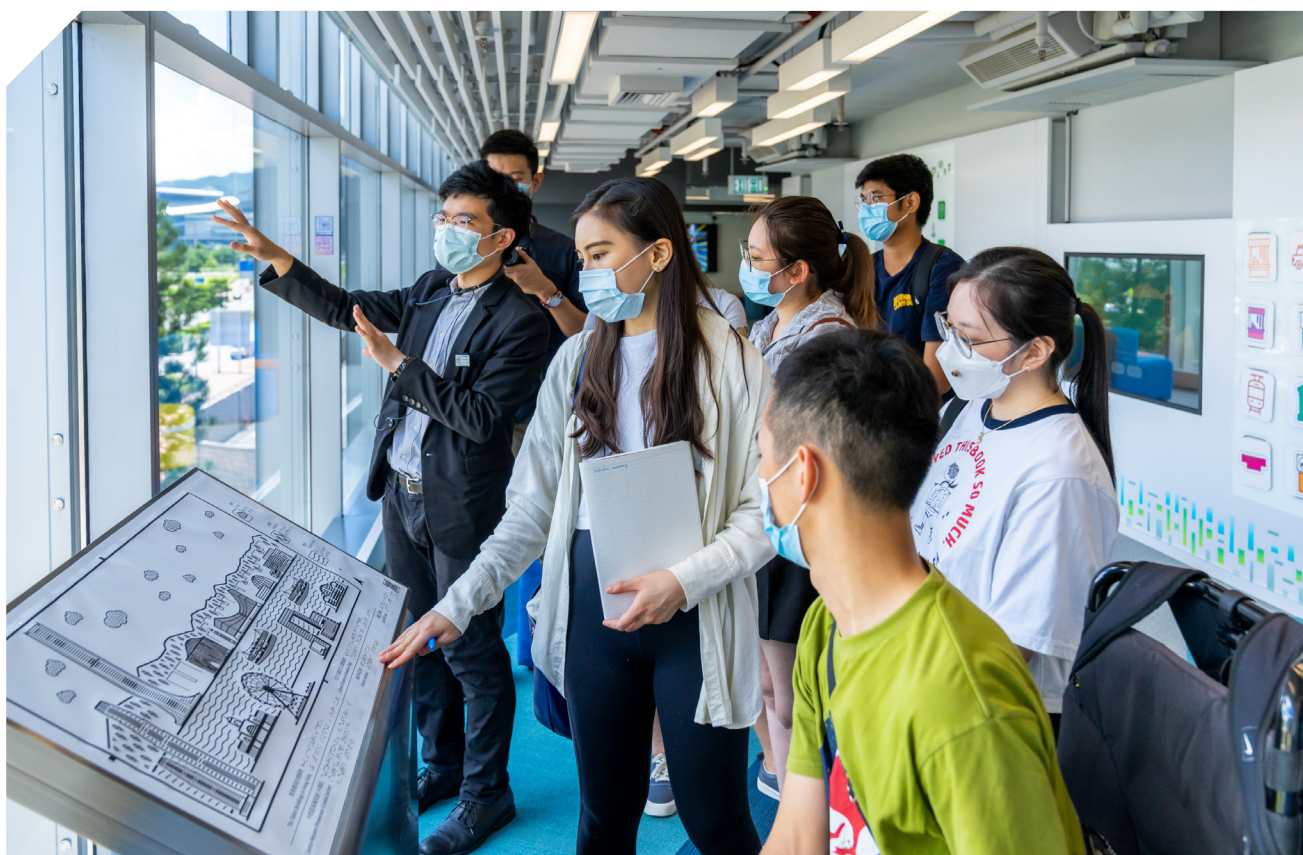
为暑期实习生举办的展城馆导赏团

展城馆已完成局部翻新工程，更新了地下、三楼及四楼的展品及提升馆内设施，并于二零二一年五月八日全面开放。尽管运作受到局部翻新工程影响，并因应2019冠状病毒病疫情需要闭馆约四个月，展城馆于二零二一年仍录得69 333参观人次。我们为不同团体提供预约导赏服务，包括政府部门、学校、大学、机构、公司、残疾人士、社区中心、长者团体及持牌旅行社举办的本地遊旅行团。