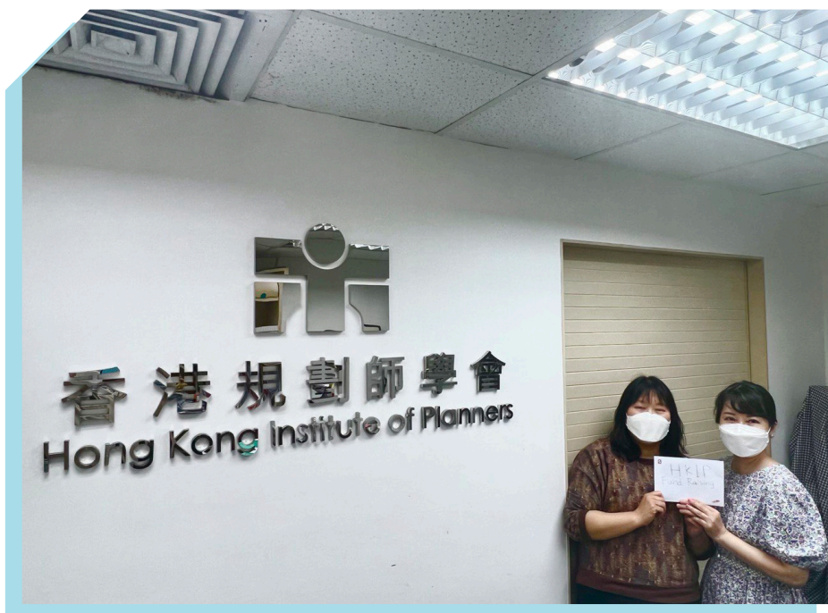
本署致送支票予香港规划师学会代表

本署职员亦积极参与由香港规划师学会举办的筹款活动，为援助有需要的市民购买防疫物资出一分力。