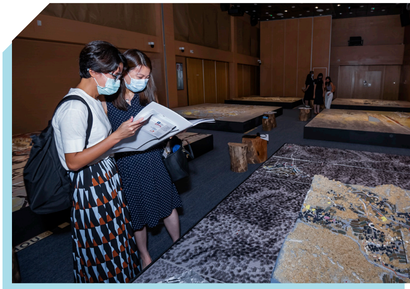
‘Hong Kong Horizontal Metropolis’ 展览