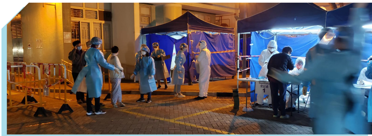
本署职员参与围封及检测行动