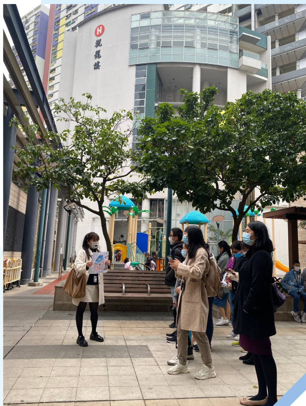
展城馆之友每月导赏团