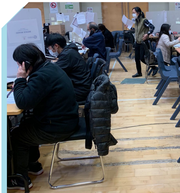
本署职员协助追踪确诊个案的密切接触者

本署动员共 50 名职员支援启德社区会堂的个案追踪办公室。职员协助追踪确诊个案的密切接触者，以减低病毒在社区传播风险。