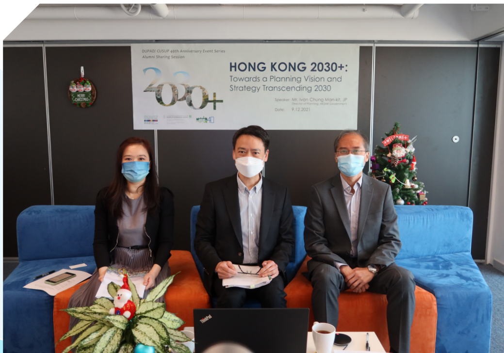
香港大学城市规划及设计系城市研究及城市规划中心四十周年庆祝活动 — 《香港 2030+：跨越 2030 年的规划远景与策略》校友分享会