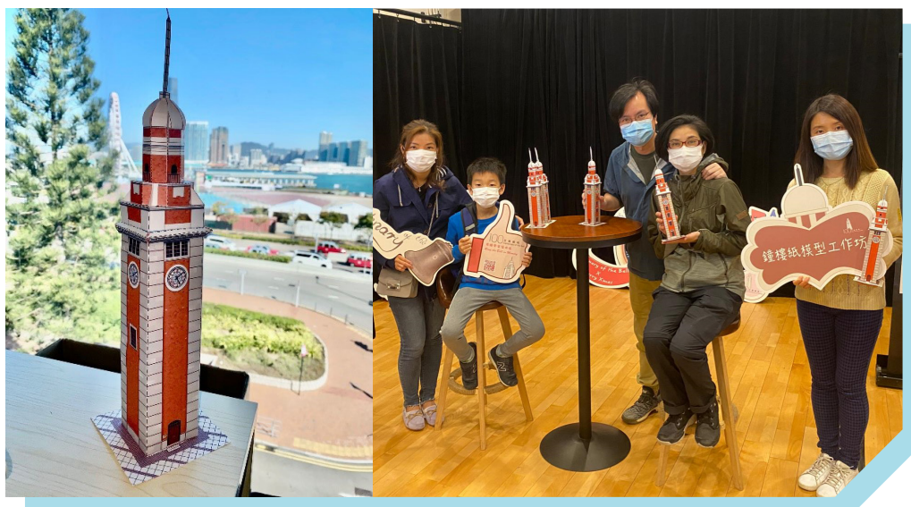
「百载钟鸣」钟楼纸模型工作坊