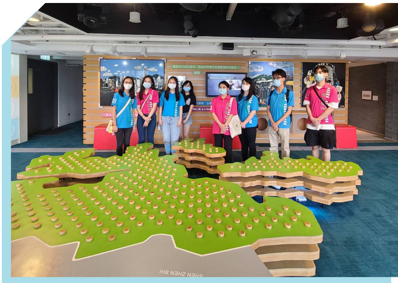
香港青年大使计划

展城馆除了作为展览场地，亦通过各项活动，加强为不同群体提供平台的角色。展城馆继续与香港青年协会合作，让「香港青年大使计划」的学员于周末及公众假期于展城馆为参观人士提供导赏服务。