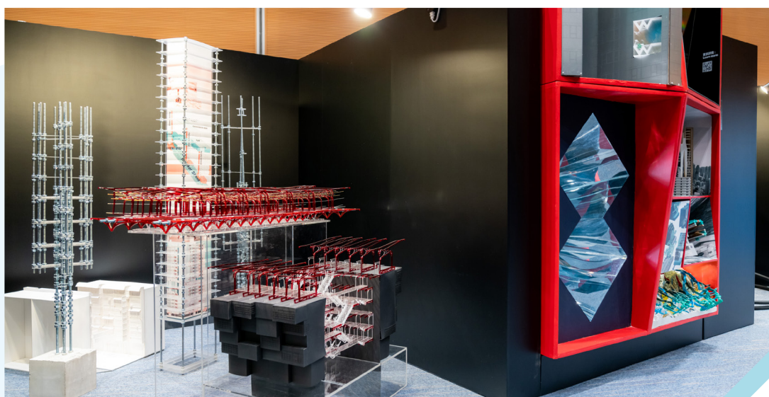
「第十七届威尼斯国际建筑双年展」香港展览