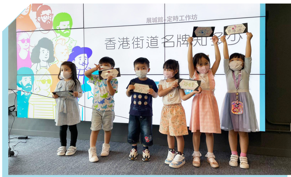
展城馆定时工作坊

自二零二一年五月重开后，展城馆恢复每月举办实体工作坊。我们于十二月联同香港文化中心、古物古迹办事处及香港天文台合办「百载钟鸣」钟楼纸模型工作坊，庆祝尖沙咀钟楼铜钟运作一百周年。