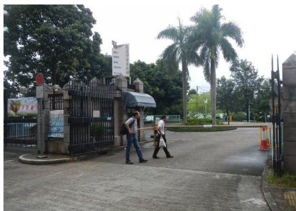
图 11：乌溪沙青年新村

规划上除提供上述主要休憩用地和康乐设施外，亦有规划意向在公共屋邨和大型私人住宅发展项目内提供足够的邻舍休憩用地和康乐设施。