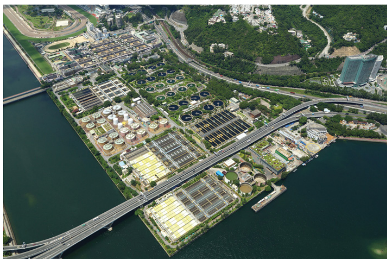
图 20：现时的沙田污水处理厂

现有的沙田污水处理厂（图 20）位于沙田新市镇内，占地约 28 公顷。政府建议把该污水处理厂迁到亚公角女婆山的岩洞，以腾出原址的土地作其他有利的用途。岩洞亦可发挥屏障的效用，阻隔可能出现的滋扰（例如气味和噪音），使区内环境得以改善。当局现正就搬迁计划进行勘测、设计及兴建工作，研究引进相关先进技术的可能性，同时参考海外的经验，务使搬迁计划能发挥最大的成效。