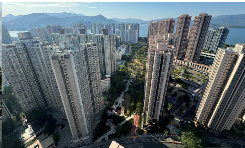
图 10：马鞍山的绿化园景廊

马鞍山的休憩用地旨在连接马鞍山郊野公园与沙田海／吐露港沿岸一带。马鞍山公园位于乌溪沙西面海旁，已发展为市镇公园。由南面大水坑通往北面马鞍山公园的海滨长廊，已开放予市民享用。