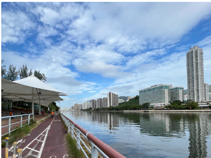
图 19：城门河畔的单车径

沙田新市镇设有安全便捷的行人路和单车径，方便行人和骑单车人士来往沙田市中心与住宅区及工业区，以及直达大部分休憩用地。马鞍山亦有类似的系统，尽量把住宅发展项目与休憩用地、社区设施和市中心连系起来。