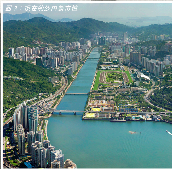
图 3：现在的沙田新市镇