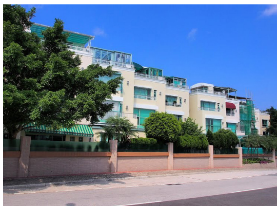
图 6：九肚的低密度住宅