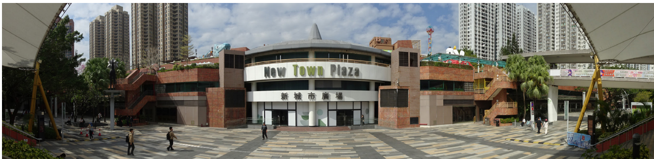
图 14：位于沙田市中心的新城市广场

沙田新市镇是新界最重要的购物和服务中心之一。在沙田和马鞍山的市中心都设有大型购物商场（图 14），公共屋邨内亦有购物中心和街市设施。