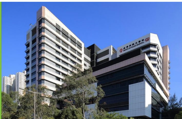
图8：威尔斯亲王医院

威尔斯亲王医院（图8）于1982年正式启用，是一家分区医院。位于亚公角的沙田医院和资助的慈氏护养院提供辅助医院服务。沙田亦有一间私家医院，扩建后可提供约600张病床。另外，沙田设有4间普通科诊疗所／健康中心，为区内居民服务。