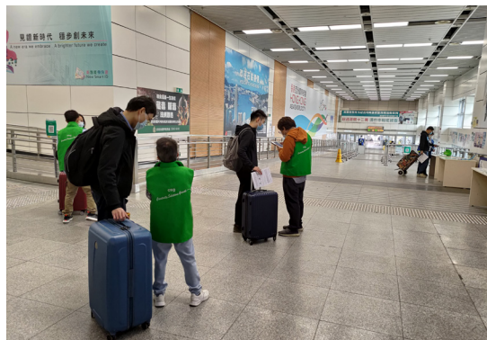
二零二一年跨界旅運統計調查