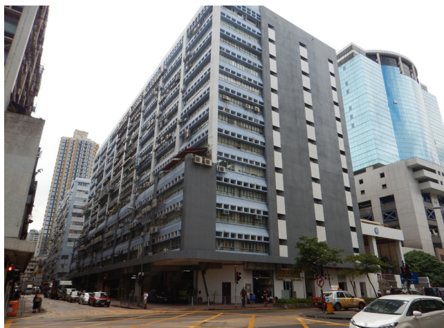
二零二零年全港工業用地分區研究