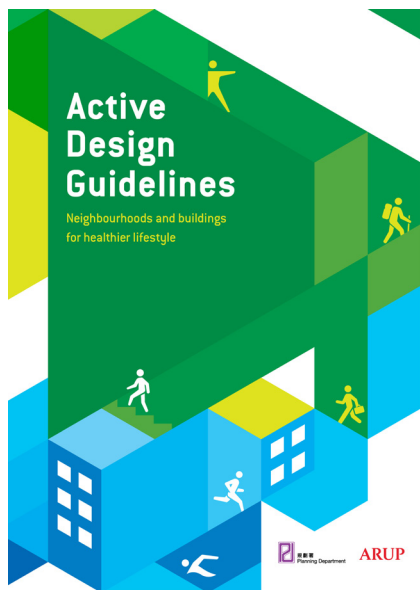
促進健康生活的動態設計研究 — 可行性研究