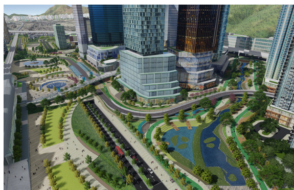
洪水橋／廈村新發展區未來市中心 及地區商業中心的都市及綠色設計 研究 — 可行性研究