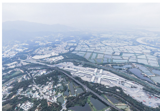
新界北第一期發展研究 — 新田 ／落馬洲發展樞紐之可行性研究