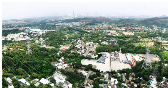
牛潭尾地區的土地用途檢討 — 可行性研究