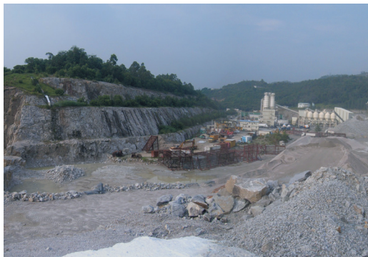
藍地石礦場及其鄰近地區初步 土地用途研究 — 可行性研究