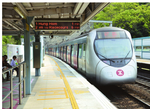
《香港 2030+：跨越 2030 年的 規劃遠景與策略》 — 運輸與 土地用途評估