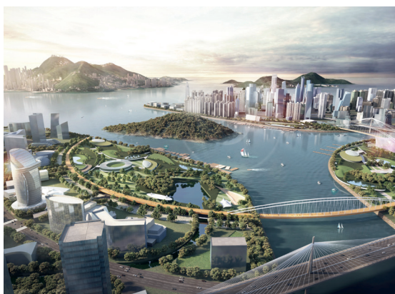
中部水域人工島研究