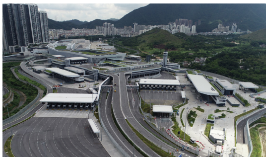
優化跨界運輸模型 — 可行性研究