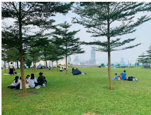
重塑香港公共空間 — 可行性研究