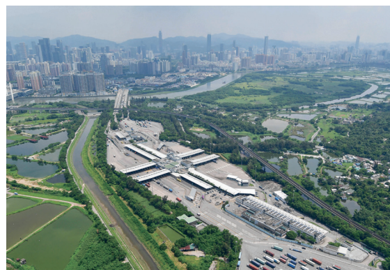
新界北第一階段發展 — 新田／ 落馬洲發展樞紐 — 勘查研究