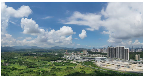
新界北餘下階段發展 — 新界 北新市鎮及文錦渡的規劃及工程 研究