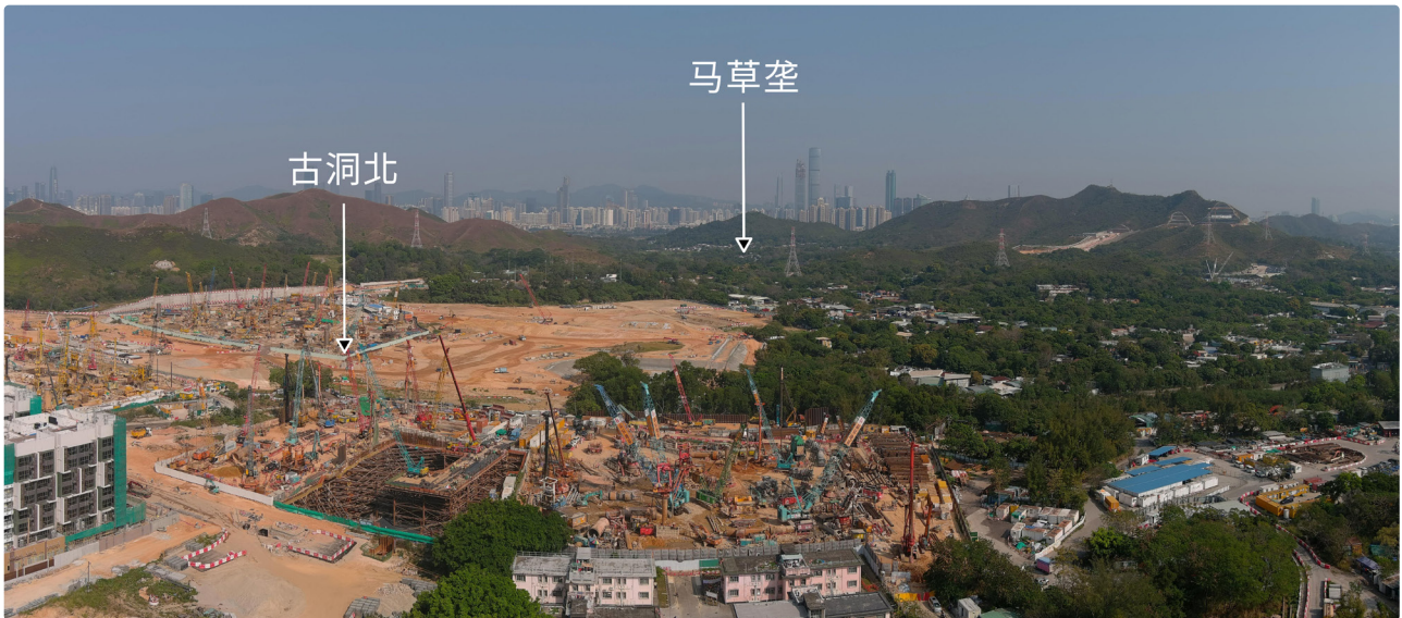
古洞北新发展区及马草垄

《北部都会区发展策略》建议把古洞北新发展区北面马草垄一带的农地及坡地纳入新发展区范围，以提供 12 000 至 13 500 新增住宅单位，及成为港深创科技园和古洞北新发展区的交汇点，为创科企业提供便捷的社区服务及生活支援。与此同时，古洞北新发展区内几组土地的功能将转移至新田科技城，有关土地用途须作检讨；而邻近梧桐河具房屋发展潜力用地的可行性有待确定。就此，本署和土木工程拓展署于二零二二年十月展开有关研究，将会制定初步发展大纲图作未来发展的指引。